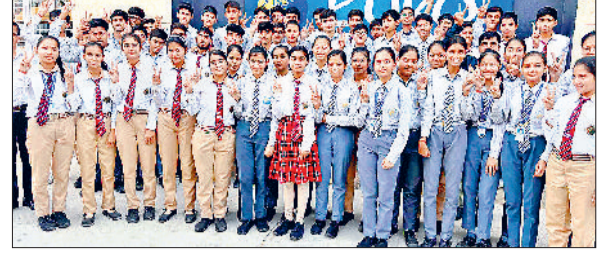
महेंद्रगढ़। विजय चिह्न बनाकर खुशी जाहिर करते विद्यार्थी।

की को आरती व व्यास जी का पूजन कर कथा शुभारंभ किया। जिसमें आचार्य बजरंग शास्त्री ने बताया कि श्रीमद्भागवत साक्षात् नारायण का स्वरूप है और मुक्ति प्रदाता है। भागवत के आरंभ में सबसे पहले सत्य को प्रणाम किया गया