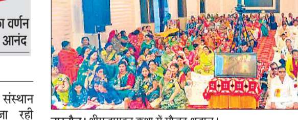
नारनौल। श्रीमद्भागवत कथा में मौजूद श्रद्धालु।