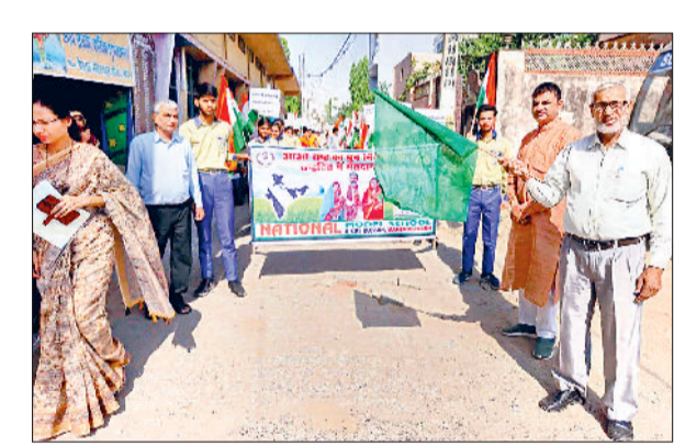
महेन्द्रगढ़। जागरूकता रैली को हरी झंडी दिखाकर रवाना करते हुए।