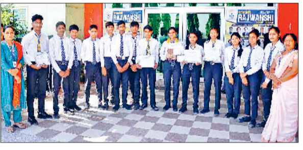
नारनौल। राजवंशी स्कूल दौचाना के विद्यार्थी।