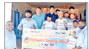
सतनाली मंडी। विश्व डेगू दिवस पर जागरूकता अभियान चलाने स्वास्थ्यकर्मी।