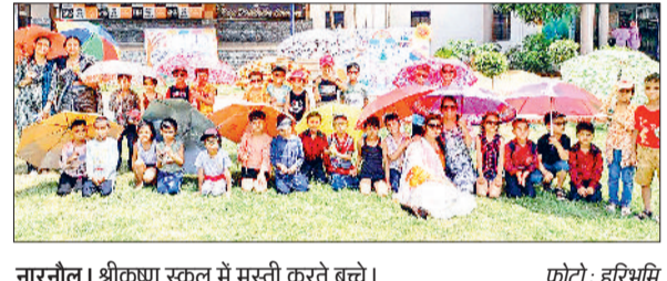
नारनौल। श्रीकृष्ण स्कूल में मस्ती करते बच्चे।