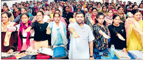
महेंद्रगढ़। मतदान करने की शपथ लेते विद्यार्थी।