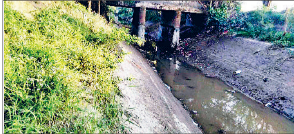
महेंद्रगढ़। सूखी पड़ी नहर और बूस्टिंग स्टेशन।

28 अप्रैल से एक दिन छोड़ एक दिन दी जा रही सप्लाई, अधीरा बूस्टिंग स्टेशन की समस्या का भी हुआ समाधान, चार वार्डों में मिलेगी राहत