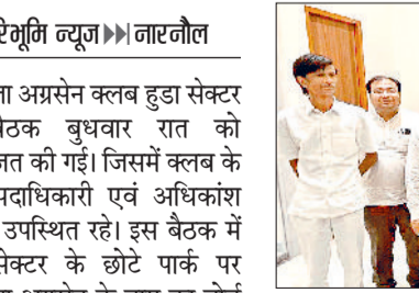
नारनौल। बैठक के दौरान रोष जताते समाज के लोग।

जिसका नाम महाराजा अग्रसेन के नाम पर पारित किया था। जिस पर अग्रसेन क्लब ने वहां महाराजा अग्रसेन पार्क का बोर्ड लगा दिया था तथा उस पार्क की देखभाल एवं सफाई का कार्य भी क्लब की ओर से करवाया जा रहा था। उन्होंने कहा कि बड़े ही खेद की बात है कि एक जाति विशेष के कुछ असामाजिक तत्वों को